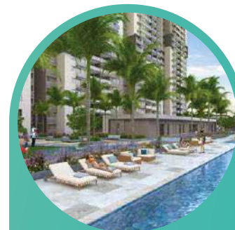
Mirador Del Puerto